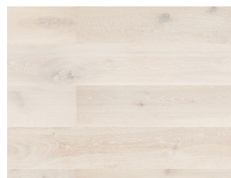
145086 Eg Country børstet Sandwash 14x220x2200 mm