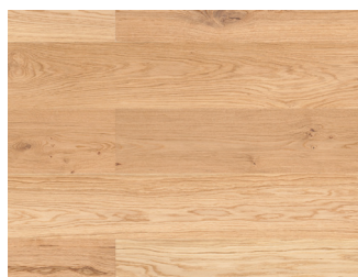
145085MM Eg Country børstet Natur 14x220x2200 mm