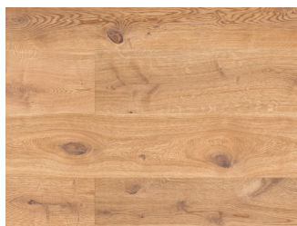
145089MML Eg Country børstet Hvid 14x260x2400 mm