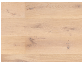
145088 Eg Country børstet Hvid 14x260x2400 mm