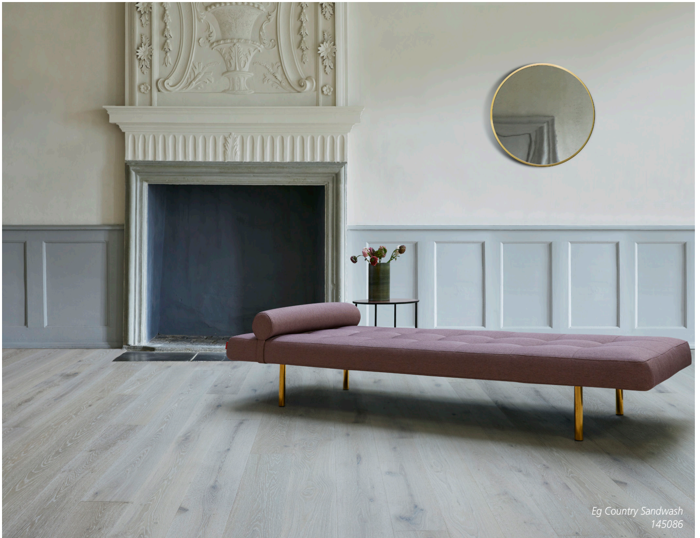
Eg Country Sandwash 145086

Timberman Wideplank • Til svømmende montage • Dim: 14x220x2200 mm / 14x260x2400 mm