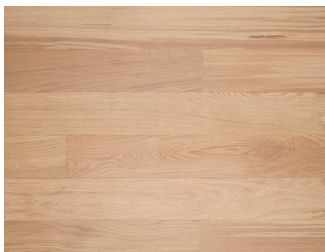
145035 Eg Accent børstet Hvid 13x145x1820 mm

Timberman Plank • Til svømmende montage • Dim: 13x145x1820 mm