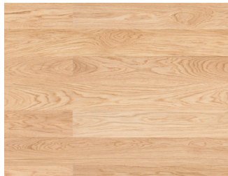
145008 Eg Accent børstet Natur 13x145x1820 mm