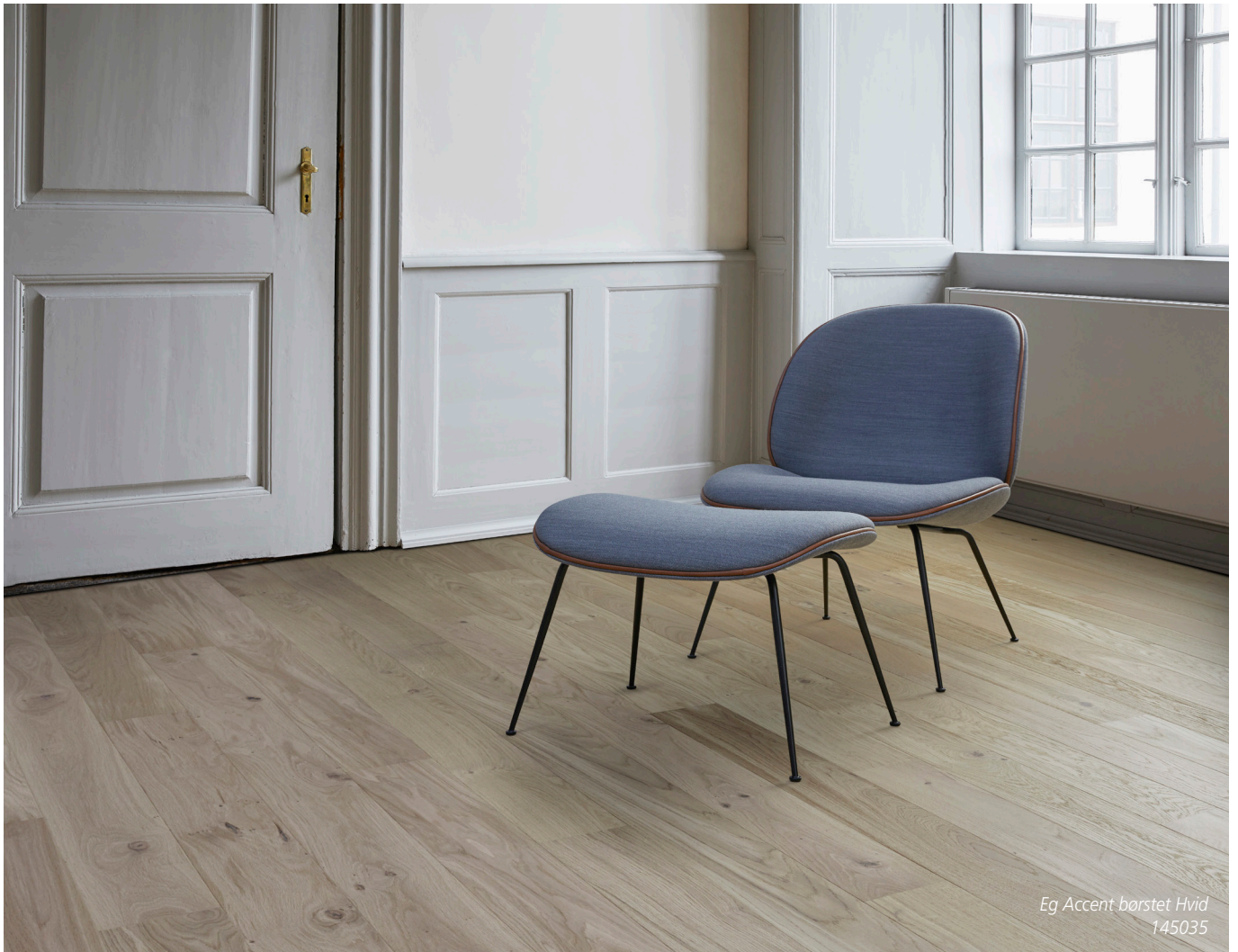
Eg Accent børstet Hvid 145035

Timberman Plank • Til svømmende montage • Dim: 13x145x1820 mm