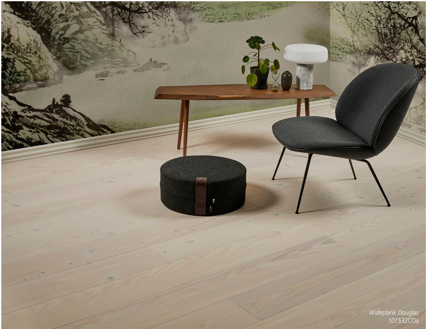
Wideplank Douglas 101532COa

Timberman Wideplank og Slotsplank • Til svømmende montage • Dim: 14x205x2400 mm / 14x185x2400 mm