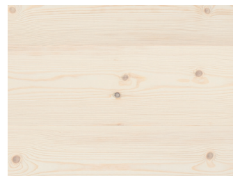
101556CO Fyrplank 14x185x2400 mm