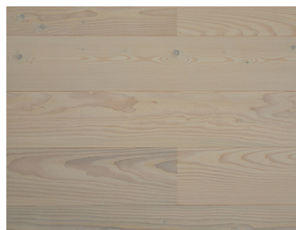
101532COa Douglas 14x205x2400 mm