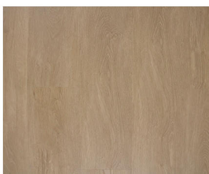
Oxford Varenr.: 155076 DB nr.: 2266376