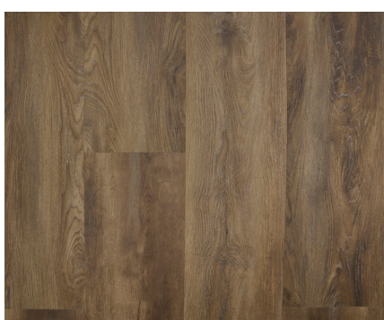
Sherwood Varenr.: 155075 DB nr.: 2266375