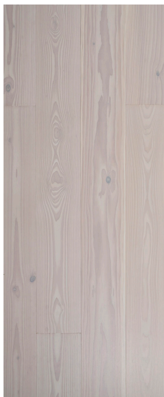
Wideplank Douglas Varenr.: 101532 DB nr.: 2273625