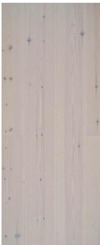
Wideplank Fyr Varenr.: 101530 DB nr.: 2273624