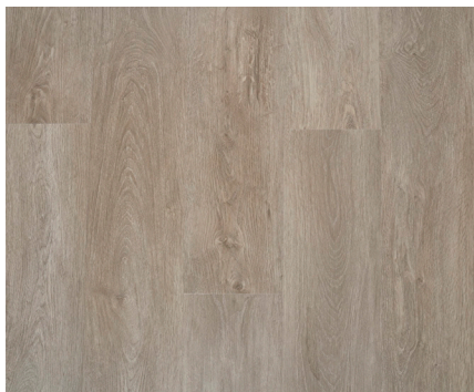
Halifax Varenr.: 155072 DB nr.: 2266372