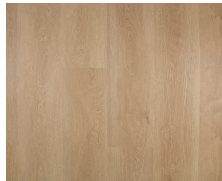
Brighton Varenr.: 155074 DB nr.: 2266374