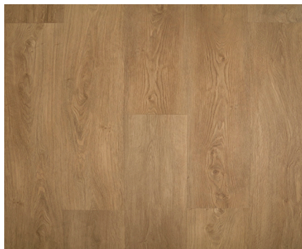
Birmingham Varenr.: 155073 DB nr.: 2266373