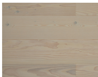
101532COa Douglas 14x205x2400 mm