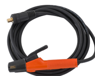
Welding cable 5 m 25 mm 2

Flexlite TX-brændere er beregnet til brug sammen med MasterTig-svejsedyr. Brænderserien omfatter flere forskellige halsversioner, der giver en uovertruffen køling og adgang til svejsning på svært tilgængelige steder.