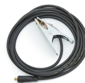
Earth return cable 5 m, 25 mm 2