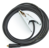
Earth return cable 10 m, 25 mm 2