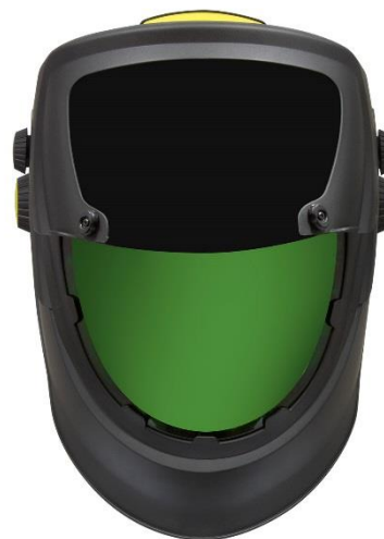
Stort indvendigt slibevisir