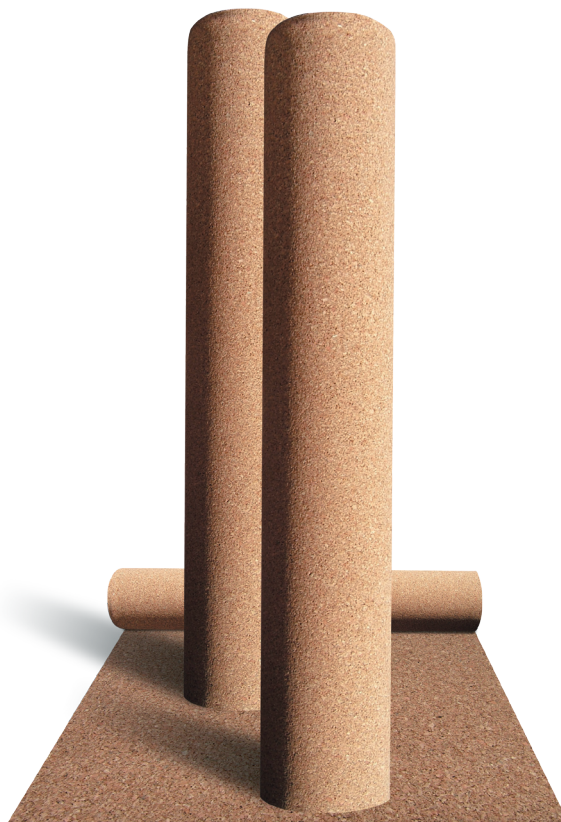
Rullekork – 1 meter bred. Rulle med 10 m 2