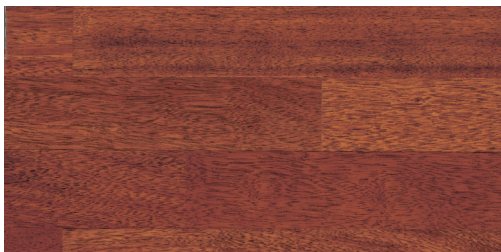
144012 Merbau Prime olie Natur 13x190x2200 mm

Timberman Parket 3-stav • Til svømmende montage • Dim: 13x190x2200 mm