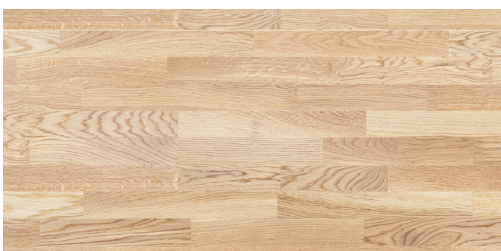
144008n Eg Accent børstet Natur 13x190x2200 mm