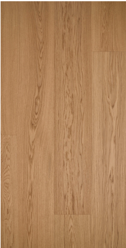
Eg Prime natur Varenr.: 147060 Db-nr.: 2279986