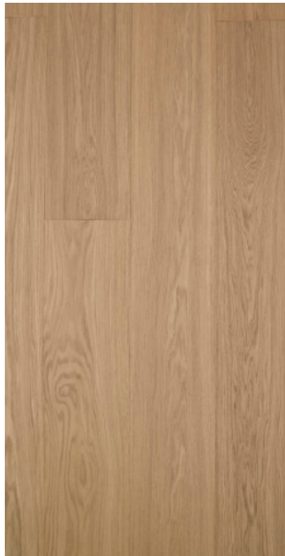
Eg Prime hvid Varenr.: 147070 Db-nr.: 2279988