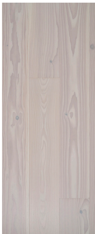
Wideplank Douglas Varenr.: 101532 DB nr.: 2273625