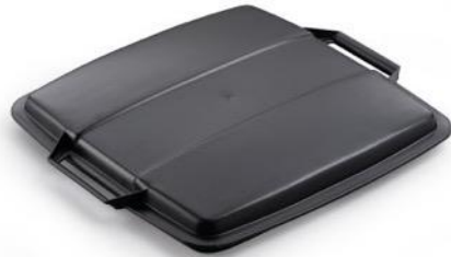
Låg DURABIN 90 L Sort 1800475221