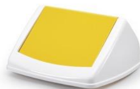
Låg DURABIN Flip 40L Gul 1801574013