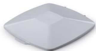
Låg DURABIN Square 40 L Grå