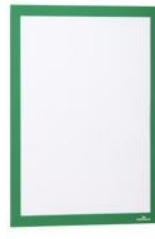
DURAFRAME A4 Grøn 487205