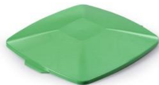
Låg DURABIN Square 40 L Grøn