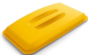
Låg DURABIN 60 L Gul 1800497030