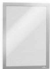
DURAFRAME A4 Sølv 487223

Mærk beholderne med dine egne skabeloner og benyt DURAFRAME ® magnetrammer for at gøre det lettere at sortere.