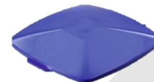
Låg DURABIN Square 40 L Blå