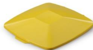
Låg DURABIN Square 40 L Gul