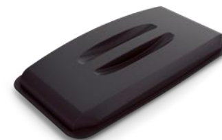
Låg DURABIN 60 L Sort 1800497221