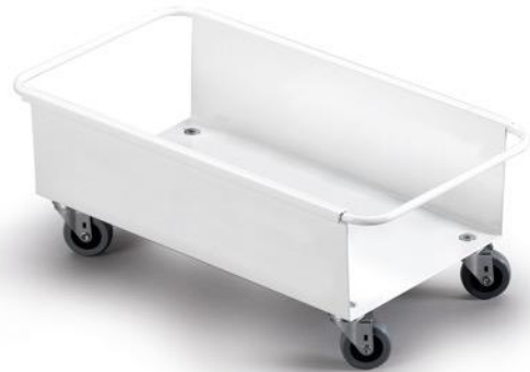
Vogn DURABIN 60 L Hvid 1801666010