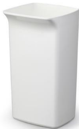
Spand DURABIN Square 40 L Hvid 1800798010

Mål inkl. vippelåg: 747x320x366 mm (HxBxD)