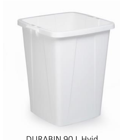
DURABIN 90 L Hvid 1800474010

Mål 605x510x 487mm (HxBxD) (inkl. håndtag)