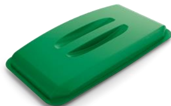
Låg DURABIN 60 L Grøn 1800497020