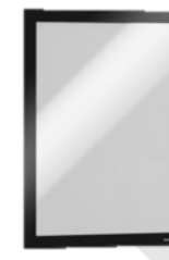
DURAFRAME A4 Sort 487201