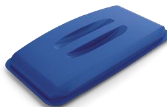
Låg DURABIN 60 L Blå 1800497040