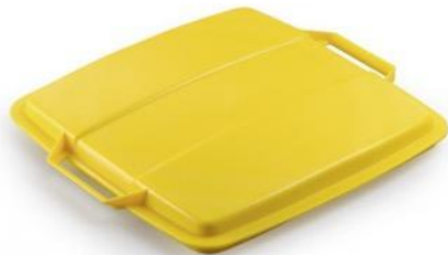
Låg DURABIN 90 L Gul 1800475030