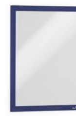
DURAFRAME A4 Blå 487207