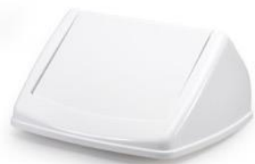
Låg DURABIN Flip 40L Hvid 1801574011