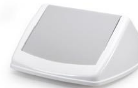
Låg DURABIN Flip 40L Grå 1801574051