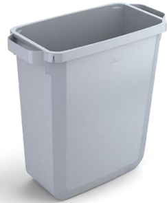
DURABIN 60 L Grå 1800496050