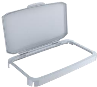
Hængslet låg DURABIN 60 L Grå 1800500050