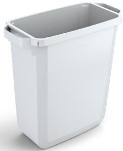
DURABIN 60 L Hvid 1800496010