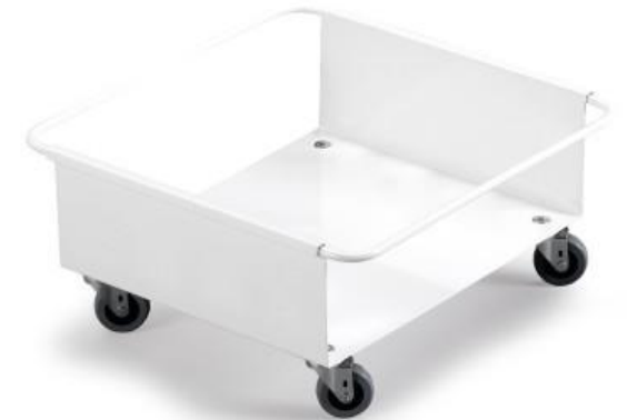
Vogn DURABIN 90 L Hvid 1801668010