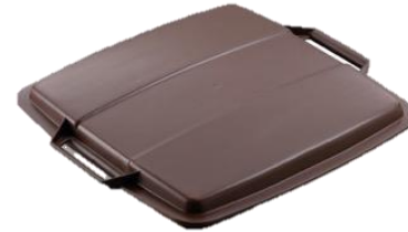
Låg DURABIN 90 L Brun 1800475210