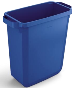
DURABIN 60 L Blå 1800496040