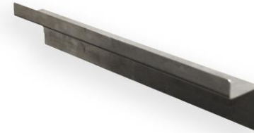
Durabin 60 vægbeslag 1801662023