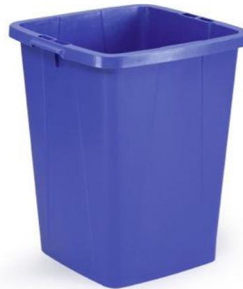
DURABIN 90 L Blå 1800474040