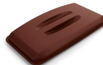
Låg DURABIN 60 L Brun 1800497210