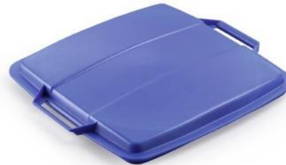
Låg DURABIN 90 L Blå 1800475040