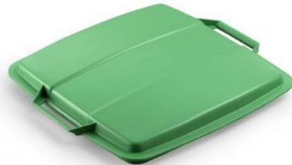
Låg DURABIN 90 L Grøn 1800475020