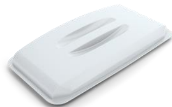
Låg DURABIN 60 L Hvid 1800497010