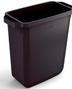
DURABIN 60 L Sort 1800496221