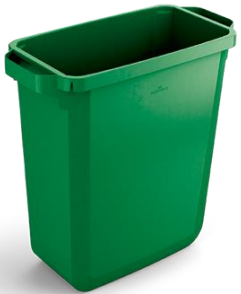
DURABIN 60 L Grøn 1800496020