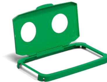
Hængslet låg DURABIN 60 L Dåse 1800501020