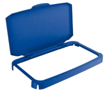
Hængslet låg DURABIN 60 L Blå 1800500040