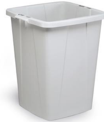
DURABIN 90 L Grå 1800474050