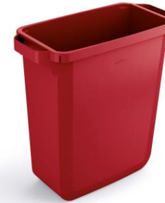
DURABIN 60 L Rød 1800496080