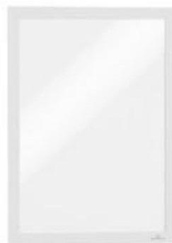
DURAFRAME A4 Hvid 487202

Mærk beholderne med dine egne skabeloner og benyt DURAFRAME ® magnetrammer for at gøre det lettere at sortere.