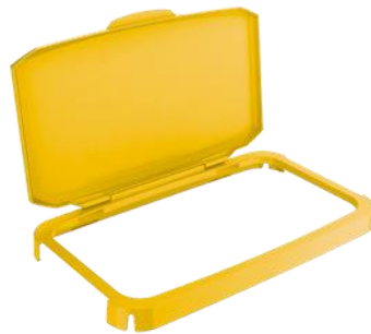
Hængslet låg DURABIN 60 L Gul 1800500030