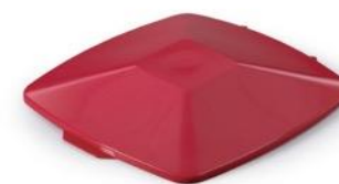
Låg DURABIN Square 40 L Rød