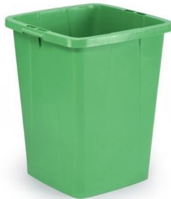
DURABIN 90 L Grøn 1800474020