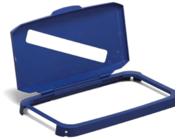
Hængslet låg DURABIN 60 L Papir 1800502040