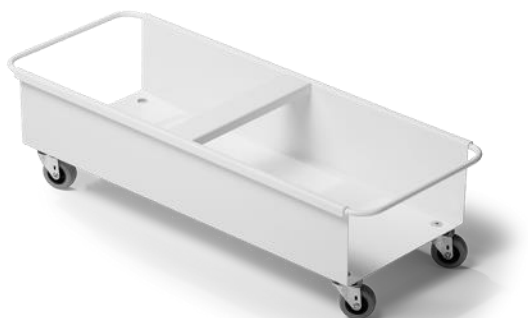
Vogn DURABIN Kvadrat Duo 40 L Hvid 1801622010