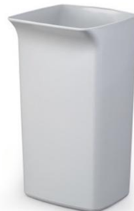
Spand DURABIN Square 40 L Grå 1800798050