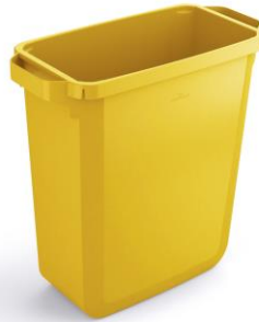
DURABIN 60 L Gul 1800496030