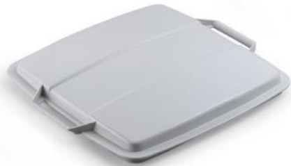
Låg DURABIN 90 L Grå 1800475050

Låg til affald DURABIN 90 liter. Med håndtag for nem håndtering.