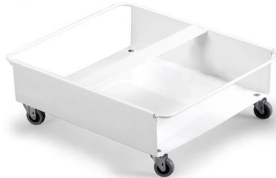
Vogn DURABIN Duo 60 L Hvid 1801667010