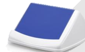
Låg DURABIN Flip 40L Blå 1801574014