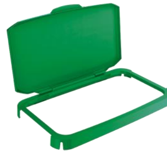
Hængslet låg DURABIN 60 L Grøn 1800500020