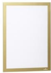
DURAFRAME A4 Guld 487230