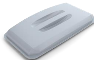
Låg DURABIN 60 L Grå 1800497050