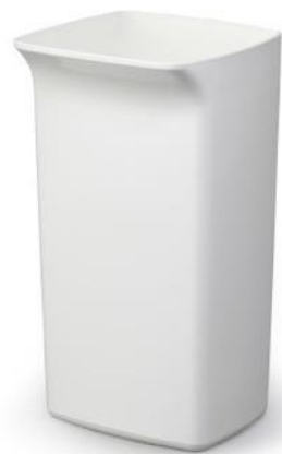
Spand DURABIN Square 40 L Hvid