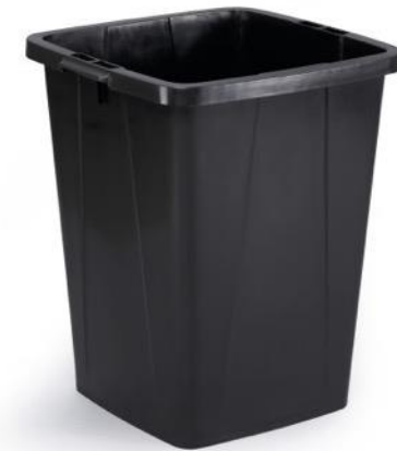
DURABIN 90 L Sort 1800474221