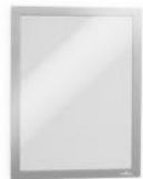
DURAFRAME A5 Sølv 487123