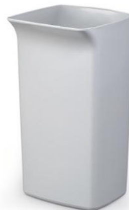
Spand DURABIN Square 40 L Grå